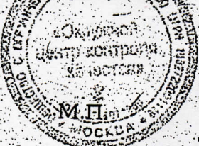
Схема сертификации 7